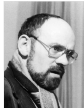
André Ratti, 1935-1986

Am 2. Juli war es soweit: An einer denkwürdigen Pressekonferenz stellte sich die eben gegründete AHS (Aids- Hilfe Schweiz) vor und ihr Präsident, ein bekannter Fernseh- Moderator, sagte, "Ich heisse André Ratti, ich bin schwul und habe Aids." Damit hatte Aids ein Gesicht erhalten, sein Gesicht. Eine Welle der Sympathie ging durch das Land. Ratti starb am 25. Oktober 1986.