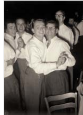
Männerpaare am Silvesterball

Die grossen Bälle des KREIS im Frühjahr (Maskenball), sowie im Sommer und/ oder Herbst galten weltweit als bedeutendste und originellste Szene- Events der Zeit. Es kamen bis zu 800 Abonnenten mit ihren Gästen. Dabei gab es tänzerische und kabarettistische