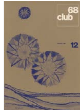
Umschlagblatt der Weihnachtsnummer 'club68' 12/1968

Club68 existierte bis Ende 1971. Ein Teil des Redaktionsteams brachte im Februar 1972 die neue Zeitschrift hey hervor, die bis Ende 1984 das Organ der SOH blieb. Im Dezember 1994 löste sich die SOH auf mit dem Wunsch an jedes Mitglied, sich der neuen nationalen Dachorganisation Pink Cross anzuschliessen.