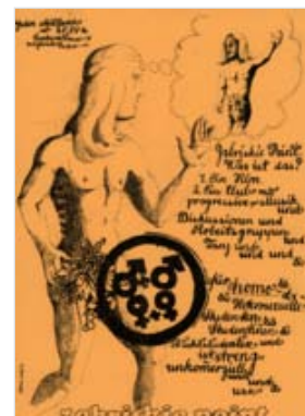
zabriskie point, 2. Flugblatt/ Flugli

1972 gelang es, das neueste Werk des jungen deutschen Filmemachers Rosa von Praunheim nach Zürich zu holen: " Nicht der Homosexuelle ist pervers, sondern die Situation, in der er lebt ". Darauf gründeten sich am 22. März die HAZ (Homosexuelle Arbeitsgruppen Zürich). Mitglieder der HAZ organisierten im Juni 1972 eine analoge Filmvorstellung unter schwul- lesbischen Studierenden in Basel und Bern, was in Basel die Entstehung der HABS (30. Juni) bewirkte und in Bern jene der HAB (6. Dezember).