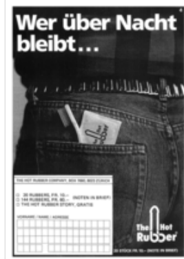
Inserat, Zeitschrift ak, 1/1986