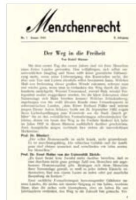
Titelblatt 'Menschenrecht', 1942