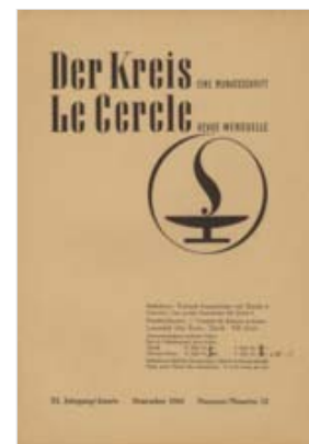
Titelblatt 'Der Kreis', 1943

Die bisherige Abonnenten- Vereinigung wurde nun zum Lesezirkel DER KREIS . Rasch entwickelte sich daraus eine Organisation mit regelmässigen Anlässen in eigenen Klubräumen, mit fachkundiger Betreuung sowohl psychologisch- seelsorgerlich als auch durch Ärzte und Rechtsanwälte, mit Leihbibliothek und Verkauf von Büchern, Kunstblättern, Fotos, mit vielfältigen Kontaktmöglichkeiten und Kontaktanzeigen im Beiblatt der Zeitschrift.