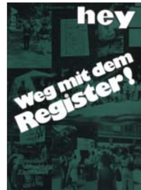
Titelblatt hey, 9/1978

Am 24. Juni 1978 gab es in Zürich einen ersten CSD (Christopher Street Day) mit Demonstration. Geplant und durchgeführt wurde er von HAZ, SOH und HFG (Homosexuelle Frauengruppe) mit dem Zweck, Unterschriften für die Abschaffung der polizeilichen Homo-Register zu sammeln. Es trugen sich fast 5500 Personen ein, womit man an die Presse und das städtische Parlament gelangte und die Vernichtung der Kartei per 1. Februar 1979 erzwang.